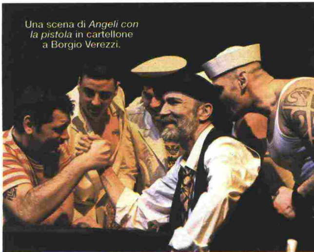
Una scena di Angeli con la pistola in cartellone a Borgio Verezzi.